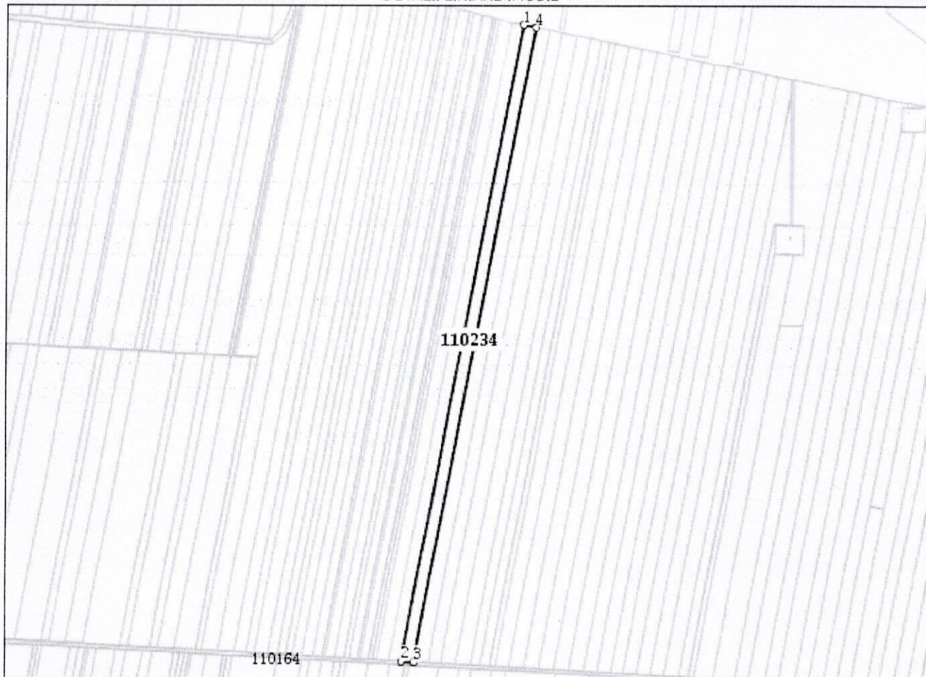
DETALII LINIARE IMOBIL

* Suprafața este determinată în planul de proiecție Stereo 70.